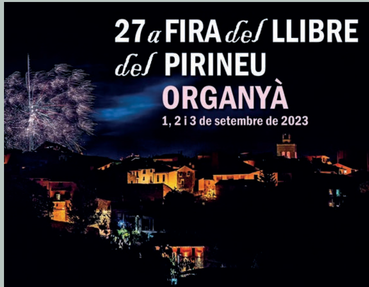
Cartell de Fira del Llibre del Pirineu d'enguany.